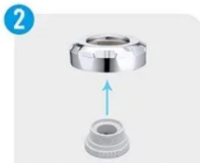
INTRODUCETI ADAPTORUL POTRIVIT IN PIULITA DE MONTARE