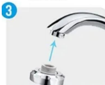
INSURUBATI PE ROBINET